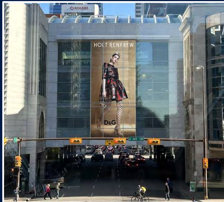
Opportunité unique et prestigieuse 📍 The Core - Calgary

Offrez une visibilité maximale là où les décisions d'achat se font. Capitalisez sur des expériences de marque et des activations sur mesure, idéales pour les lancements et ouvertures.