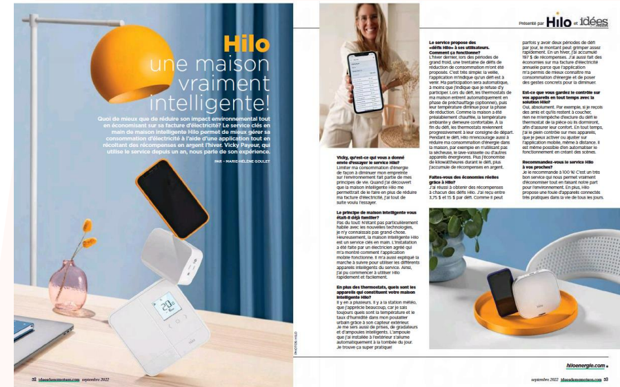
Exemple : Hilo