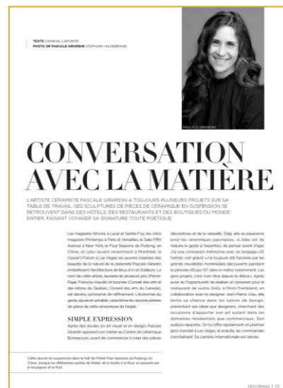
PORTRAITS de créateurs et d'entreprises renommées