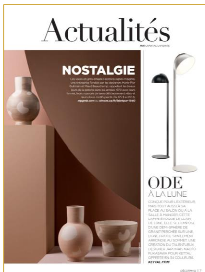
ACTUALITÉS du milieu