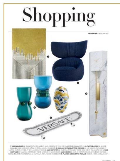
SHOPPING de produits d'exception